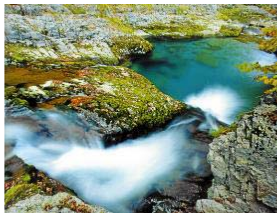
'Bosque de las Hayas': sinfonía de color en otoño. 'El Quebrantahuesos', que es motivo de portada. Al lado, el río Arazas, donde habita el tritón del Pirineo. Y abajo, dos sarríos: la hembra de sarrío descansa junto a su pequeña cría.